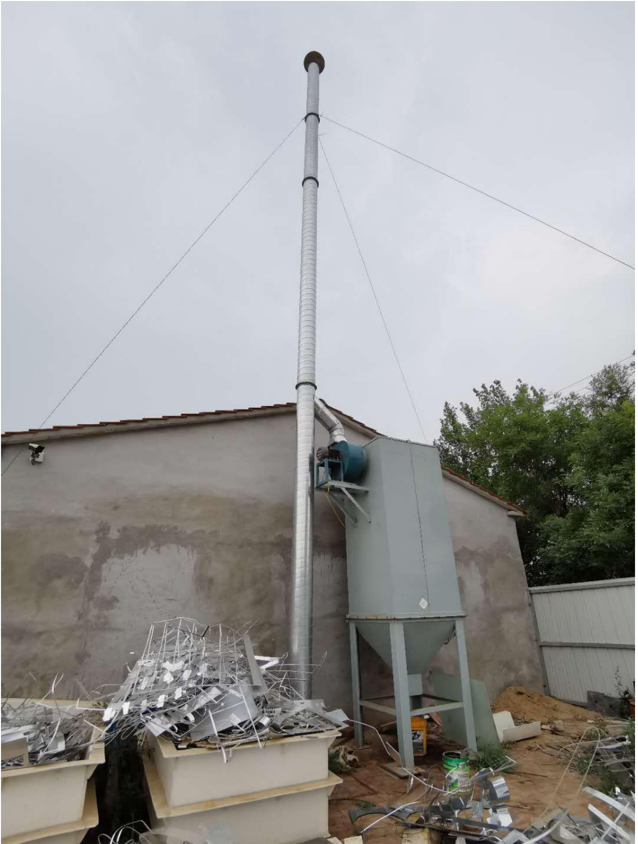
有组织废气排气筒