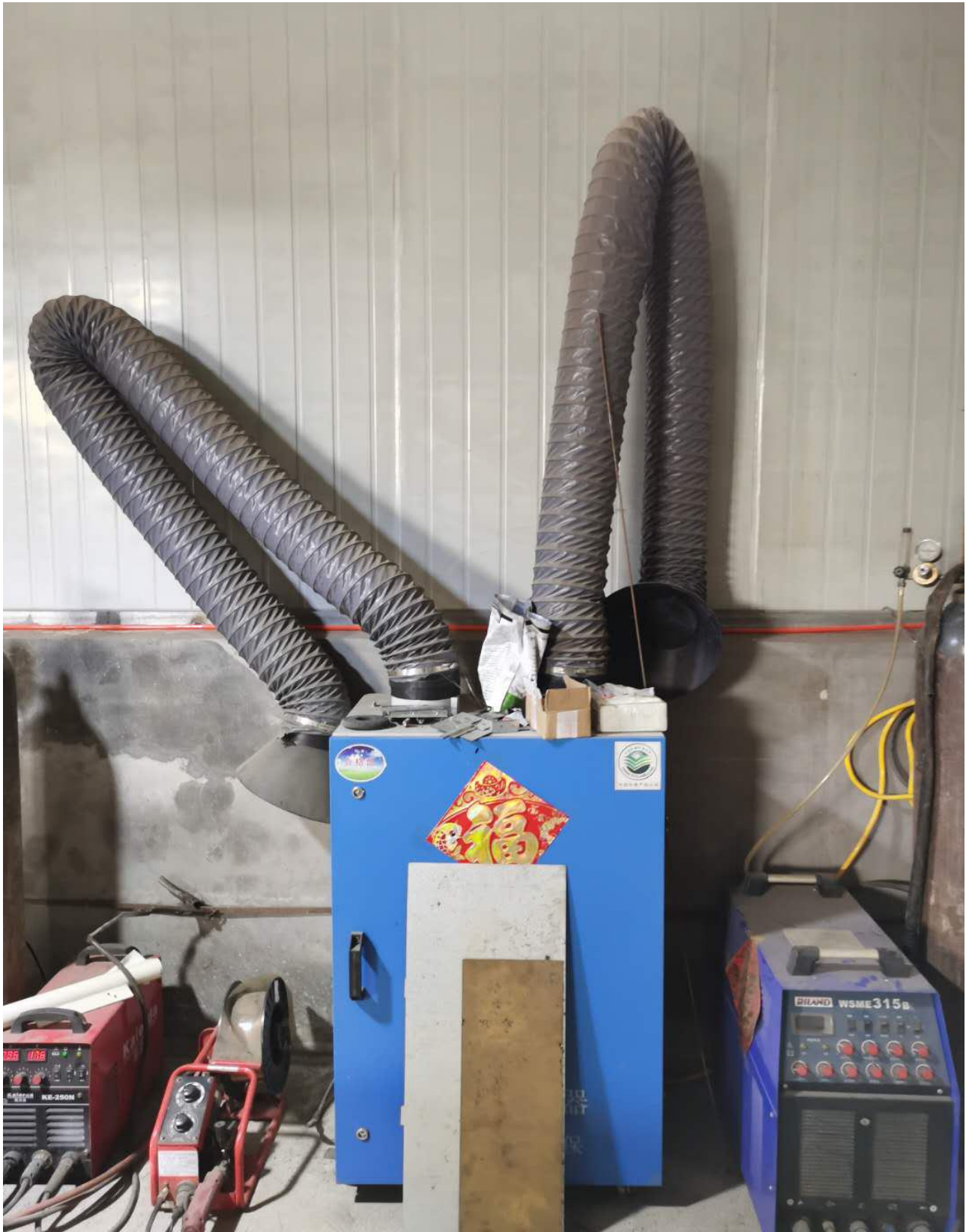
移动式烟尘净化器